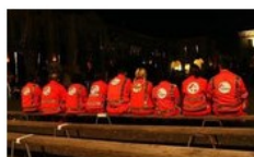
MANIFESTAZIONI ED EVENTI