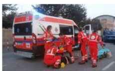
EMERGENZA URGENZA 118